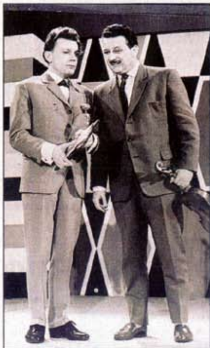
Das führende Komikerduo der DDR: Rolf Herricht (links) und Hans-Joachim Preil.